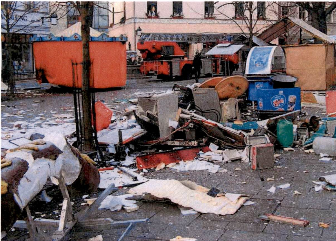
Abbildung: Auswirkungen einer Explosion eines Imbisswagens infolge einer undichten Flüssiggasanlage am 26.11.2004 auf dem Weihnachtsmarkt Weimar